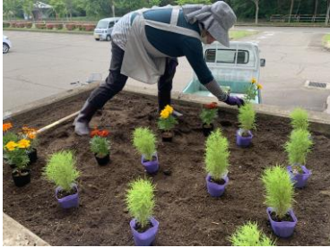
《6月8日、ユートピアくびき希望館》

女性部の初夏の活動、まちを彩る「花いっぱい運動」が6月8日、商工会館や希望館周辺で行われました。午前9時に部員が集まり、商工会館前の花壇からスタート。土を掘り起した後、マリーゴールド、ペチュニア、トレニア、リネアリス、コキアなどの花苗5種類を植栽しました。この時期恒例の活動とあって部員みなさんは慣れた手つきで作業が進み、約1時間で終了しました。