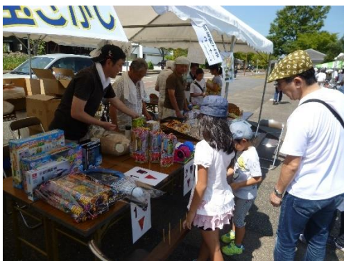
▲子供たちが夢中でくじを引き当てる宝さがしゲームに担当役員も汗だくで対応＝希望館中央広場

第 40 回頸城の祭典が 8 月 5 日、ユートピア希望館中央広場で開催され、猛烈な暑さにもかかわらず家族連れなどで大変な賑わいを見せました。40 回目を迎えた今年の祭典。猛暑が続く中、この日の最高気温も 36.8℃と、つらい暑さでしたが熱中症もなく、会場内では一日中、笑顔が絶えませんでした。