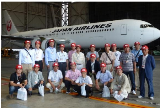
▲JAL 整備工場格納庫のボーイング 767 型機の前で記念撮影＝7 月 9 日

また一行は、蔵の街「川越」や両国の「江戸東京博物館」などにも立ち寄り、有意義な研修旅行を堪能しながらそれぞれ親睦を深めていました。